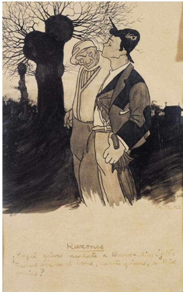
Alfonso Daniel Rodríguez Castelao, Razones , 1915, técnica mixta sobre papel, 33 x 19,5 cm, Colección de Arte Afundación

No século XIX continuaba vixente en Galicia o sistema foral xerado no medievo. A Igrexa era a gran propietaria da terra a través dos mosteiros, e cedíalles aos labregos o dereito a cultivala e habitar as casas a cambio dunha renda: unha parte da colleita en especie (trigo, centeo, viño...), prestación de servizos ou cobro en metálico. Este contrato adoitaba durar varias xeracións ou incluso ser imperecedeiro. Ademais, no século XVI a fidalguía comezou a actuar de intermediaria entre os labregos e o clero. Lucrábase conseguindo a concesión dos foros por parte da Igrexa e subarrendándolles a terra aos labregos multiplicándolles o prezo.