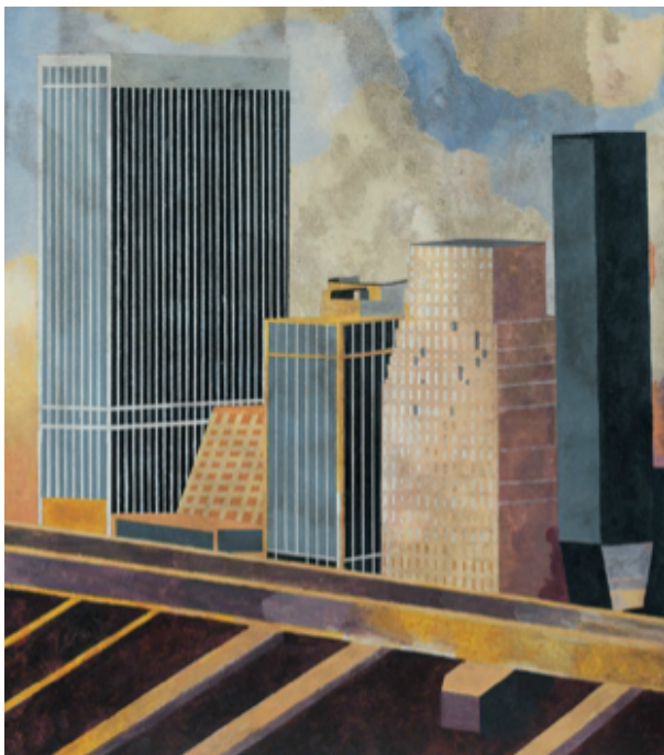
Jorge Castillo, New York , 1988, óleo sobre lenzo, 92 x 73 cm, Colección de Arte Afundación

Grazas aos aforros chegados de América, no primeiro terzo do século xx desapareceu definitivamente a fidalguía e xurdiu un novo campesiñado de pequenos propietarios que ao pouco se converteron en gandeiros, e Galicia adquiriu unha certa especialización na produción de carne. Á súa vez foise desenvolvendo unha pequena revolución industrial vinculada ás conservas e á explotación dos recursos mariños, especialmente na cidade de Vigo.