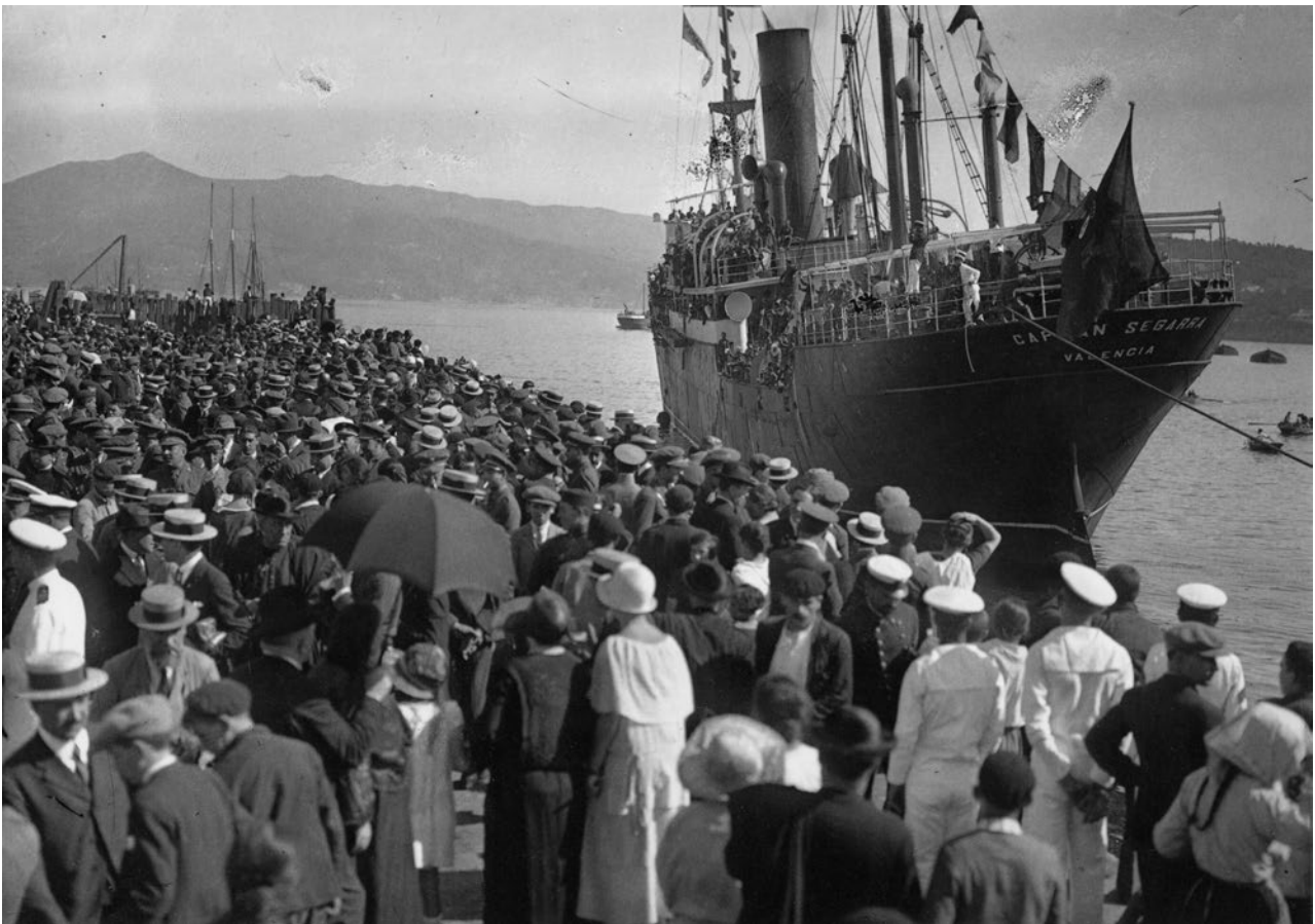
Pacheco, Despedida de emigrantes, porto de Vigo, cara a 1915

procura dun futuro mellor. Para entender a dimensión deste fenómeno debemos ter en conta que a poboación actual de Galicia é de 2,7 millóns de habitantes. Durante este período, Galicia situouse entre os lugares do mundo con maior emigración xunto a países coma Irlanda ou Italia. Hai dúas grandes etapas na emigración galega: a emigración a América de finais do século XIX e a Europa na segunda metade do XX.