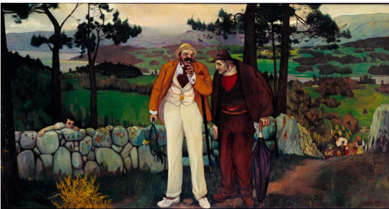
Castelao, Regreso del indiano , 1918, Colección de Arte Afundación