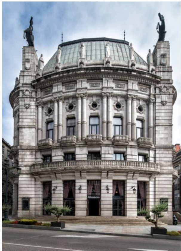
Teatro García Barbón en Vigo, na actualidade, Teatro Afundación